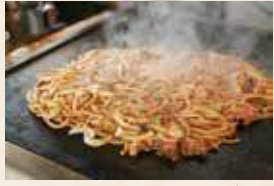
津山ホルモンうどん