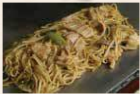
鳥取ホルモン焼きソバ