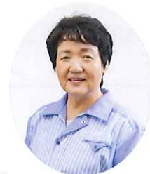
主な公職 (一社)神戸市機械金属工業会会長 (一社)神戸経済同友会副代表幹事 神戸商工会議所女性会元会長