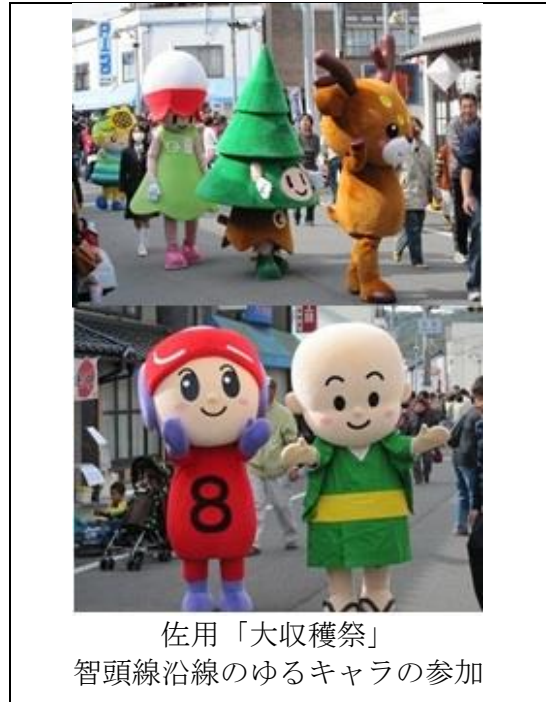
佐用「大収穫祭」 智頭線沿線のゆるキャラの参加

また、佐用「大収穫祭」では、智頭急行沿線のゆるキャラの参加等の交流事業も実施した経緯もあり、今後は各商工会・市町のイベントにお互いが特産品の出展などで参加交流を行い、地域同士が交流を深めることにより、因幡街道沿線の広域観光を全国にアピールし、より多くの観光客の誘致に繋げていく。